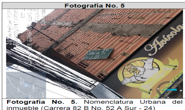
Fotografía No. 5. Nomenclatura Urbana del inmueble (Carrera 82 B No. 52 A Sur - 24)