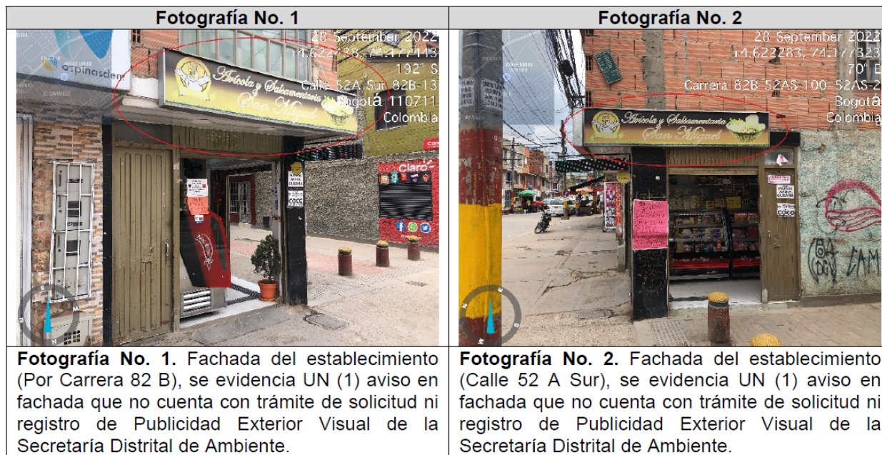
Tabla 3. Registro fotográfico